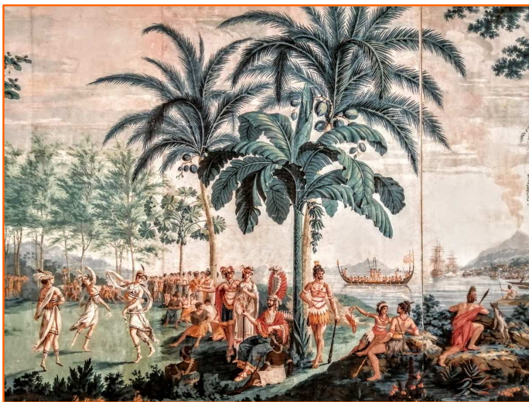
Un papier peint exposé au Musée des Ursulines à Mâcon

en 1806. Les îles du Pacifique au XVIII ème visitées par les Cook, de Bougainville et La Pérouse répondaient au goût pour l'exotisme initié par ces explorateurs ainsi qu'à l'attrait pour les voyages des élites du temps. Cette période se caractérise aussi par l'engouement pour l'Antiquité car on vient de découvrir les villes de Pompéi et Herculaneum, objets de fascination pour le visiteur avec leurs tranches de vie figées sous les cendres du Vésuve en l'an 79.