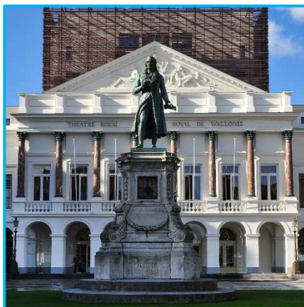
Opéra Royal de Wallonie - Liège